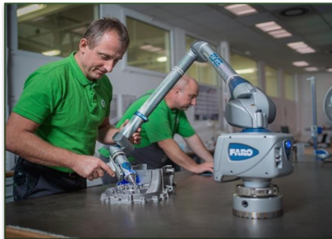
Messung mit 7-Achs-Faro-Arm