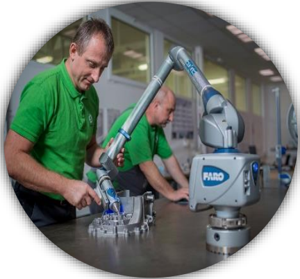
Messungen im Prüfraum