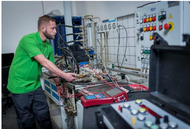
Komponententesten am Prüfstand