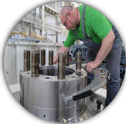
Messungen im Betrieb

„Operativer Einsatz im Betrieb – z. B. Presswerk M15.“