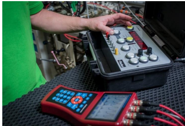
Manuelle Bedienung – Datenanalyse